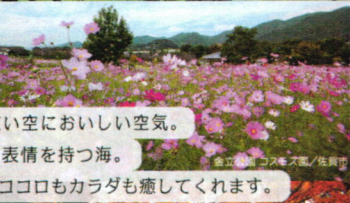
秋に染むむらさき / 志賀町