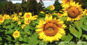
浜野浦の朝田 / 玄海町