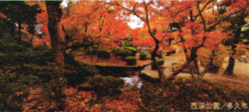
西家公園 / 多久市