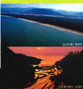
紅の松原 / 唐津市