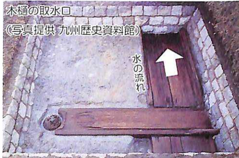
木樋の取水口

土塁の下には内濠と外濠をつなぐ木製の導水管である「木樋」が設置されていました。木樋は長さ 80m、内法が幅 1.2m、高さ 0.8m を測り、厚さ 30cm ほどの板材を組み合わせ、底には枕木が敷かれていました。内濠には木樋と交差する取水口があり、他の事例から複数の流入口をあげることで流す水の量を調整していたと考えられます。