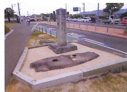
水城跡 東門礎石 (東門跡)