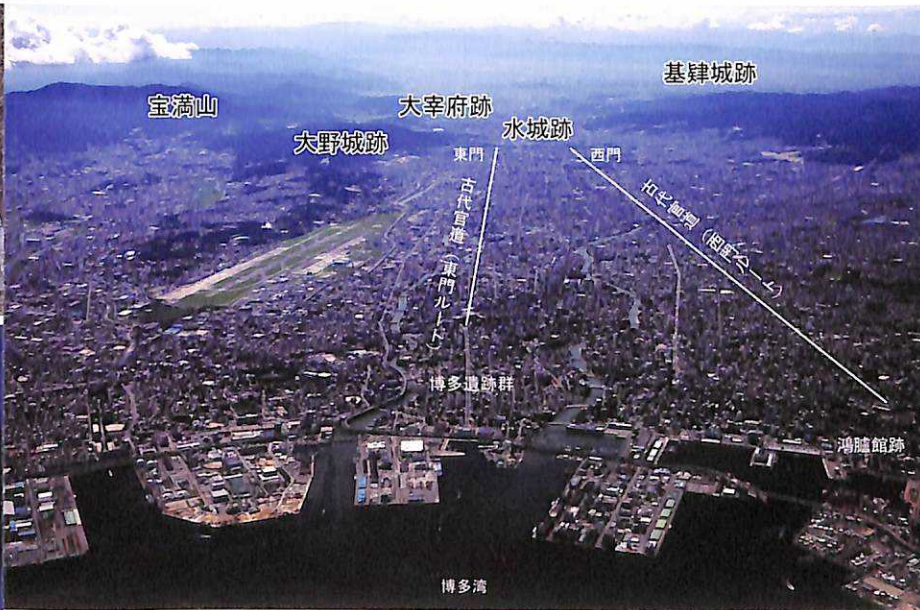
博多湾から見た水城と古代官道(北西から)

西門から延びた古代官道（公的に管理された直線道路）は迎賓施設の筑紫館（鴻臚館）へ、東門からは博多に至り、海を通過して都や諸外国とつながっていました。