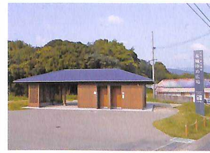
水城ゆめ広場 (西門周辺)