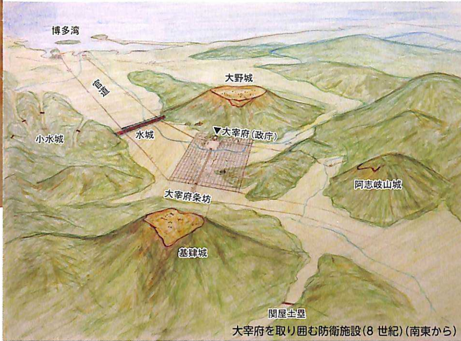
大宰府を取り囲む防衛施設(8世紀)(南東から)

水城は大宰府の前面（大陸・博多湾側）に設けられ、城壁としての役割を果たしました。大宰府への正面入り口の関所としても機能しており、外来者はここを通過して大宰府に入りました。