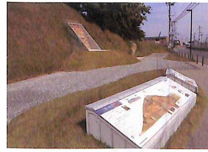
土塁断面ひろば (中央土塁)