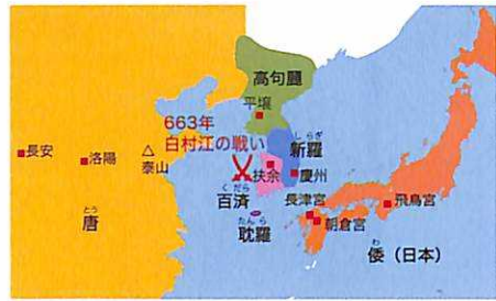
7世紀後半の東アジア

7世紀後半の朝鮮半島では国の存亡をかけた戦いがくり広げられました。新羅は唐と結んで百済や高句麗を滅ぼしました。