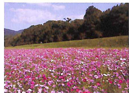
水城跡 土塁 (東土塁)

地元の人々に守られた水城は国の指定で特別史跡（水城跡）となり、周辺の景観を保持しながら文化財として保護されています。