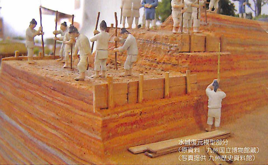
水城復元模型部分 (原資料 九州国立博物館蔵)

水城は長さ 1.2km、幅 80m、高さ 10m の土塁と、内外に水をたたえた濠からなり、福岡平野の最も狭くなった場所をさぐように築造されています。