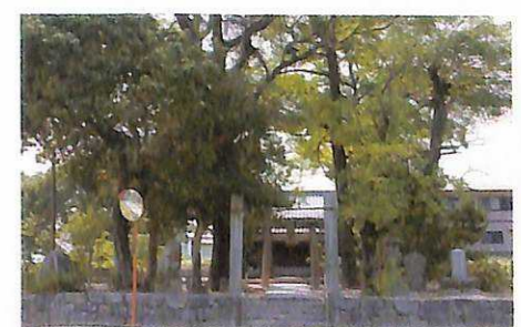
5 坂本八幡宮 昔の坂本村の鎮守さま。大宰帥の邸宅があった場所ともいわれています。

アプリの利用は無料ですが、ダウンロードやご利用時にかかるパケット通信料はお客様のご負担となります。