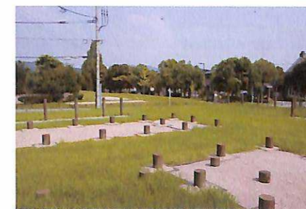
2 月山東官衙跡 発掘調査で、丘に寄り添うような建物がみつかりました。