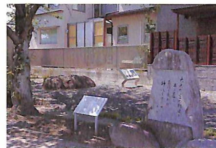
1 朱雀門礎石 政庁の一番南にあった門の礎石といわれています(写真左奥)。手前は万葉歌碑です。