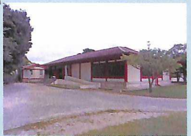
大宰府展示館【無料 月曜休館(月祝の時は翌日休館)】