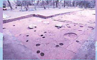
！ 現在調査中につき立ち入りはできません。