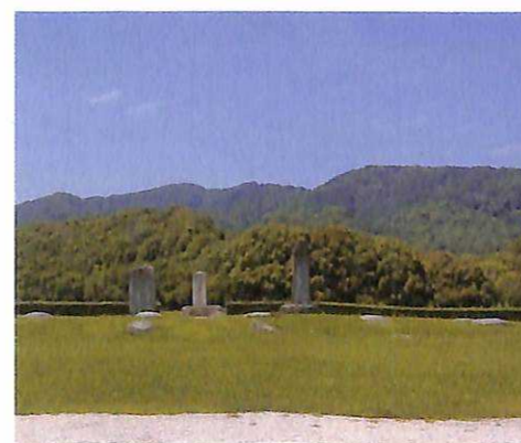
4 大宰府政庁跡 無料アプリでVRが楽しめます。 http://www.dazaifu-japan-heritage.jp