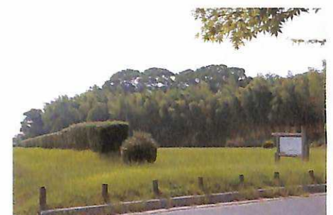
3 蔵司地区官衙 この西側の谷から九州で初めて木簡(文字が書かれた木札)が出土しました。