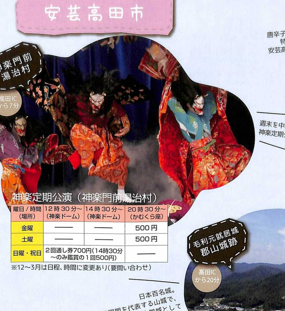
安芸高田市... 神楽定期公演(神楽門前湯治村)...

山部峠の御神水... 山奥の人気の名水スポット◎あの木舟木大舟も覗きやした〜とか!