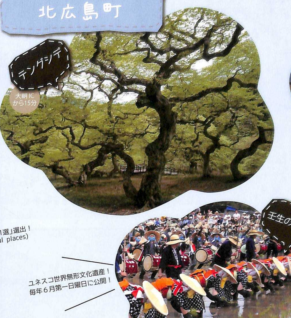
大朝のテングシテ... 天を謳うくねくねと曲がった枝が、しかもテングが出てきそうな奇麗な高木！