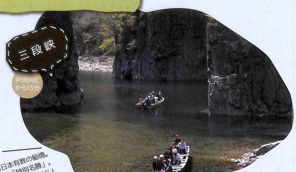
三段峡... 西日本有数の絶景。国の特別名勝。...