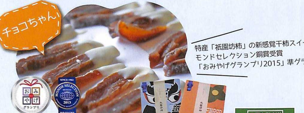
ちょこちゃん... 特産「振国坊栴」の新感覚干柿スイーツ。