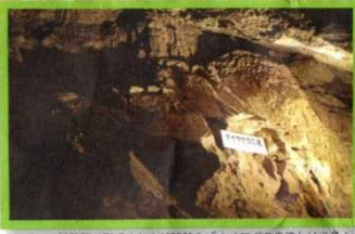
鍾乳石で形成された神秘的な「ナイアガラの滝」は必見!

第1洞に比べて道が狭くて短い第2洞。上ったり下ったり揮舞気分が一層盛り上がるゾーンだ!