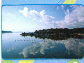
ボラ待ちやぐら漁が再開されました。