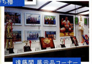
遠藤関 展示品コーナー