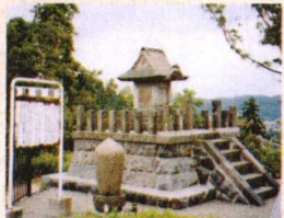
謙信廟と門察和尚の墓